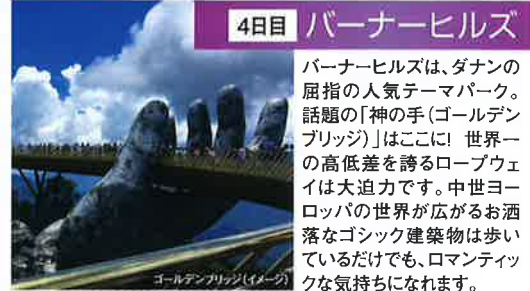
ゴールデンハンド(イメージ)

ダナンのシンボルとして愛される人気観光地の「ドラゴンブリッジ」。その名が示す通り、昇り龍が水面をうねるようにアーチが描かれたデザインが印象的な全長600mの大きな橋です。