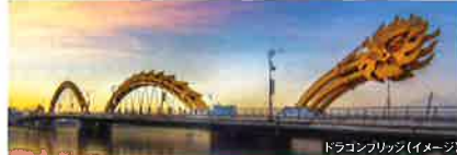
ドラゴンブリッジ(イメージ)