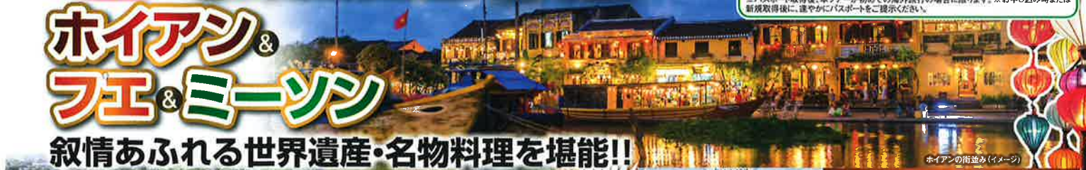
ホイアンの街並み(イメージ)

※パスポート取得後、本ツアーが初めての海外旅行の場合に限ります。※お申し込み時または新規取得後に、運営がパスポートをご提示ください。