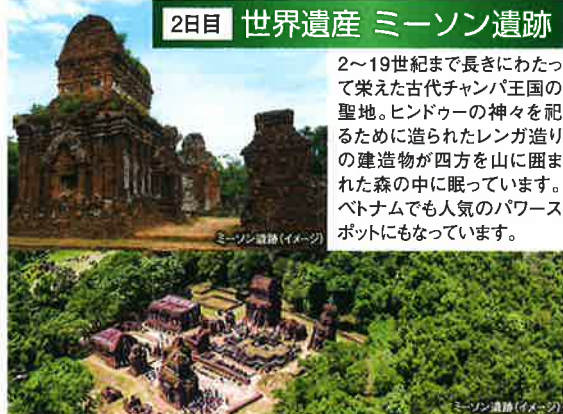
ミーンソン遺跡(イメージ)

バーナーヒルズは、ダナンの屈指の人気テーマパーク。話題の「神の手(ゴールデンブリッジ)」はここに! 世界一の高低差を誇るロープウェイは大道力です。中世ヨーロッパの世界が広がるお洒落なゴシック建築物は歩いていけるだけでも、ロマンティックな気持ちになれます。