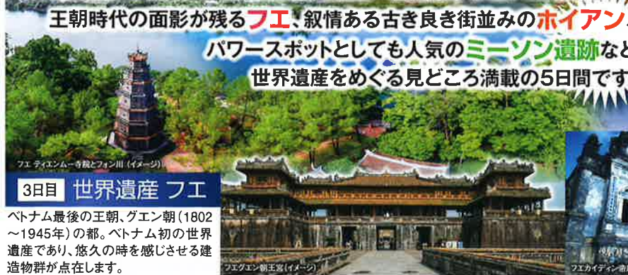
フエ ティエンムー寺殿とフォン山 (イメージ)

海洋交易の中継地として栄え、16〜17世紀には1000人以上の日本人が住んでいたというホイアン。日本の職人が建築したと言われている来道橋(日本橋)や、中国ゆかりの福建会馆など叙情あふれる街並みが広がります。