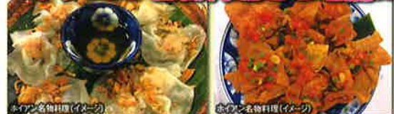
ホアン名物料理(イメージ)