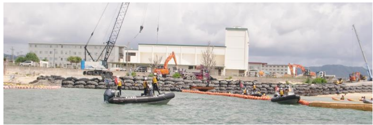
作業用道路工事を行っていた N5 の工事現場の様子。赤嶺議員は抗議中のカヌーチームを激励しました。